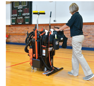
Entretien et sécurise les sol sportifs.