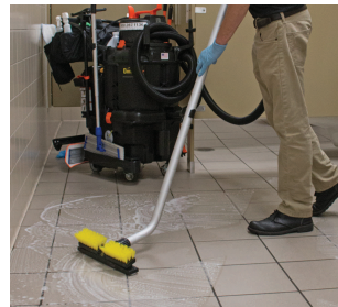
Parfait pour les sanitaires, restaurants.