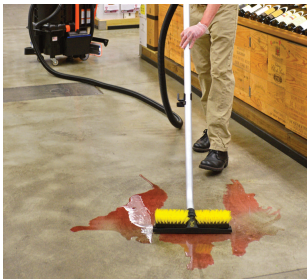
Rapide, intervention immédiate