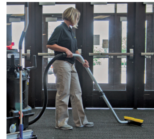
Maintenance des halls d'entrée.