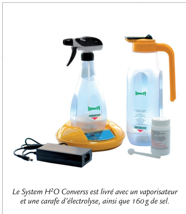
Le System H 2 O Converss est livré avec un vaporisateur et une carafe d'électrolyse, ainsi que 160 g de sel.