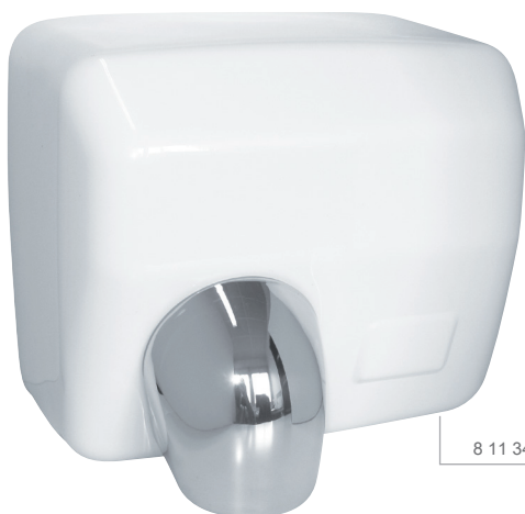
8 11 341