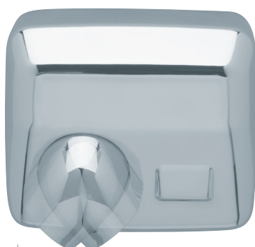
8 11 378