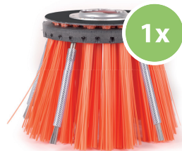
La brosse de désherbage Weedee® supprime les mauvaises herbes des joints et de la surface